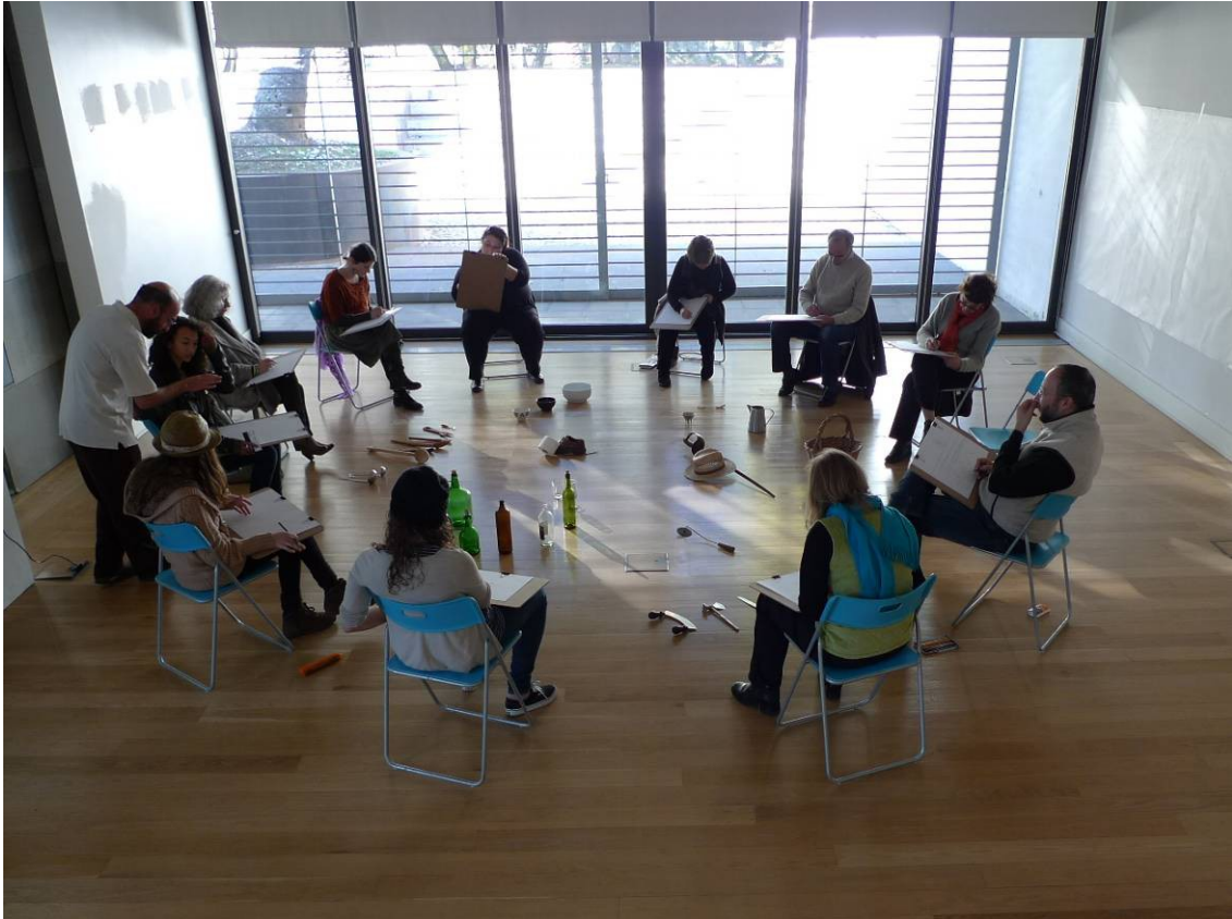
atelier no CAMB