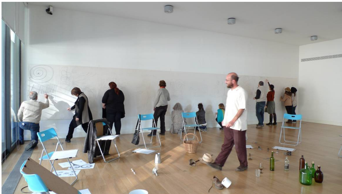
atelier no CAMB