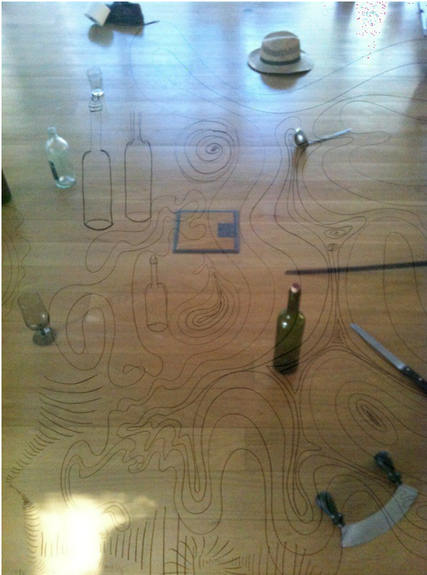
atelier no CAMB